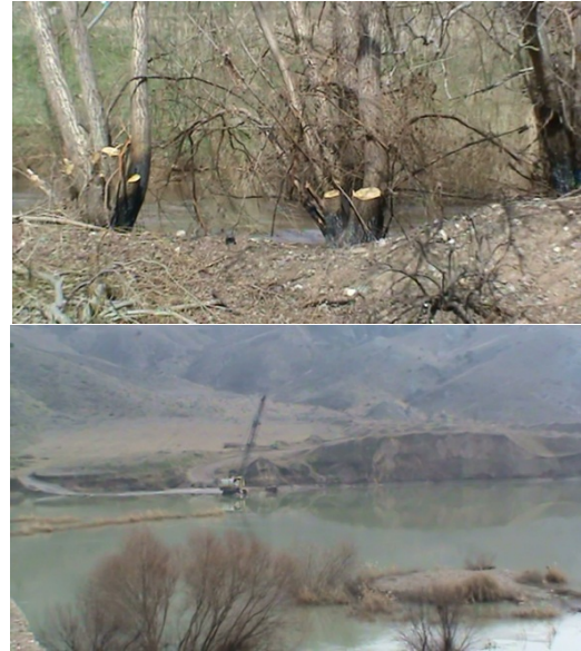
Şekil 2. Kırıkkale'deki tehdit faktörlerinden sırasıyla kesilmiş (üstte) ve yakılmış kıyı ağaçları ve kum ocaklarıyla genişletilmiş nehir yatağı (altta)

I. istasyonda saz kesimi ve yakılması önemli bir habitat tahribatı oluşturmaktadır. Bundan dolayı kuşların üreme alanları zarar görmektedir. Avcılığın kontrol edilmemesi ve özellikle kış aylarında artış göstermesi bir diğer tehdit unsurudur. Ayrıca tarım arazilerinin nehir yatağına çok yakın olması, kimyasal madde kullanımı ve gürültü kirliliği de tehdit oluşturmaktadır. Kum ocaklarından dolayı nehir yatağı genişlemiş ve nehir suyunun hızının yavaşlaması (Şekil 2), üreyen türleri olumsuz etkilemektedir.