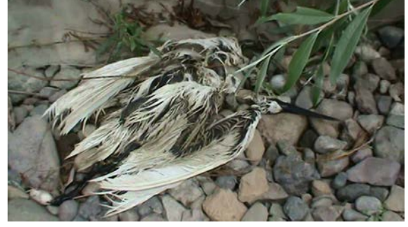
Şekil 5. Ölü bulunan küçük akbalıkçıl

Yerel halkla yapılan sözlü görüşmelerde daha önceleri balıkları tükettiği gerekçesiyle üreme döneminde kuş yavrularının öldürüldüğü beyan edilmiştir. Günümüzde bu tür olaya rastlanmazken avcılık nedeniyle öldüğü sanılan bir küçük akbalıkçıla Mayıs 2011'de I. istasyonda rastlanılmıştır (Şekil 5).