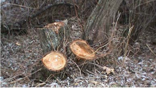
Şekil 3. Kırıkkale Kızılırmak kenarında biriken atıklar (üstte) ve kesilmiş ağaçlar (altta)

III. istasyonda endüstriyel ve evsel atıklar nehre taşınmakta ve üreme sahası olarak kullanılan ağaçlar sık sık kesilmektedir. Makine ve Kimya Endüstrisi (MKE) tesislerinin baca gazı ve atıkları da kirliliğe sebep olmaktadır. Kızılırmak boyunca hafriyat boşaltılmakta ve bunlar vejetasyon örtüsünü yok etmekte ve nehir suyunu kirletmektedir. Ayrıca nehir kenarına taş setler örülmekte ve riperyan örtü tamamen ortadan kaldırılmaktadır. Kapulukaya Barajına su toplanması sırasında nehir yatağının zaman zaman tamamen kuruması alanda beslenen türlerin burayı terk etmesine yol açmaktadır.