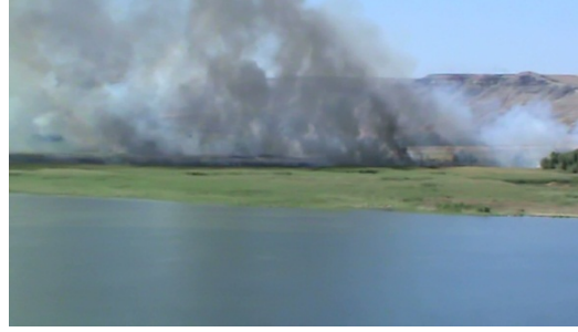
Şekil 4. Kırıkkale Köprüküy'de saz ve anız yakılması

Özellikle kış aylarında nehir kenarında çevre düzenlenmesi ve kum ocaklarındaki her türlü aktiviteler, üreme sahasına zarar verdiğinden dolayı kuşların bu alanları terk etmesine yol açmaktadır. Su rejimine yapılan sürekli müdahaleler, özellikle üreme dönemlerinde yuva ve yavru kaybına neden olmaktadır. Göç sırasında kuşlar nadiren yüksek gerilim hatlarına çarpılmaktadır. İstasyonlarda kuş türlerine yönelik insan kaynaklı tehdit faktörleri ve olumsuzluklar Çizelge 1'de gösterilmiştir.