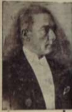
1881 Mustafa Kemal Atatürk (Öldü 1938)