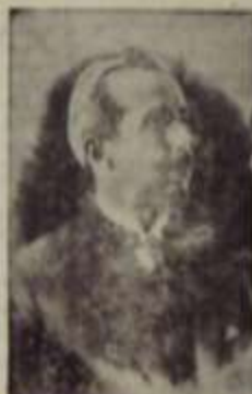
1884 İsmet İnönü (Öldü 1973)