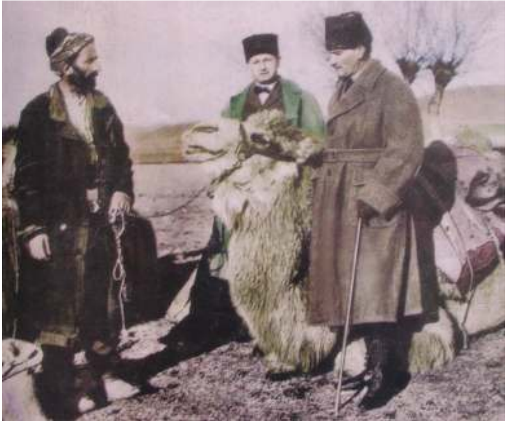
5- Atatürk, Yahşihan civarında deveçilerle sohbet ederken Temmuz 1921.

(Resim 4-5, 99 İl Yıllığı'ndan alınmıştır.)