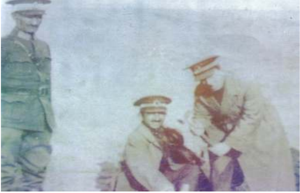
1- Mühimmat Fabrikasının temel atma çalışmaları 1925