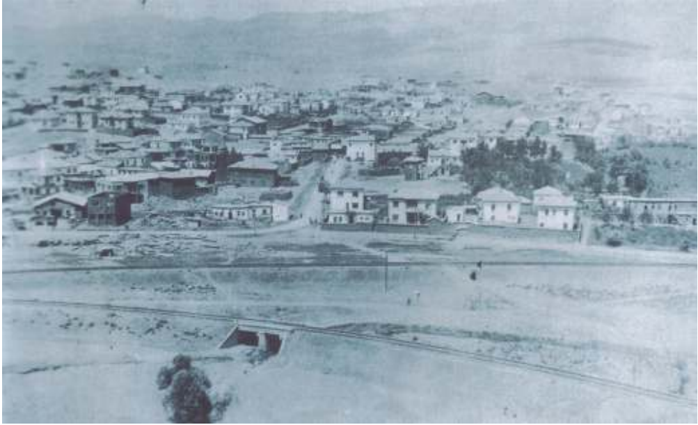
Kırıkkale'den görünüş 1928 (Resim 1-2, 99 İl Yıllığı'ndan alınmıştır.)