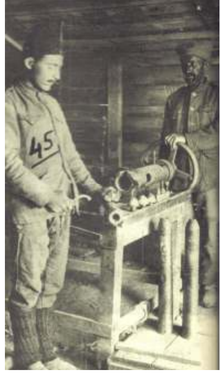
9-Kurtuluş savaşı sırasında 7.62 cm.lik merminin 7.5 cm.lik topa uydurulması için topa üzerinde çalışan işçi