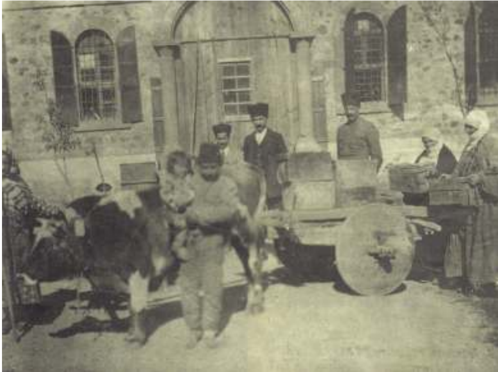
7- Keskin Fişek imalathanesinde hazırlanmış mermilerin cepheye nakli

(Resim 6-7 MKE Dergisi, S. 100 den alınmıştır)