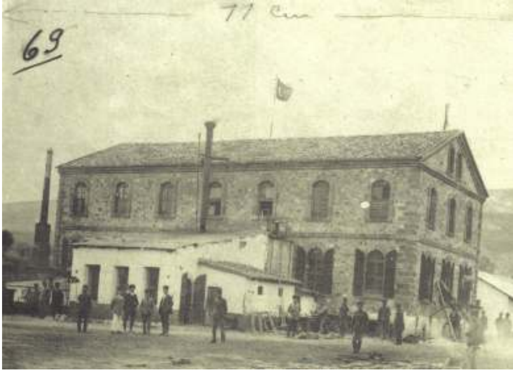
6- Kurtuluş savaşı Keskin Fişek imalathanesinin yapımı 1921