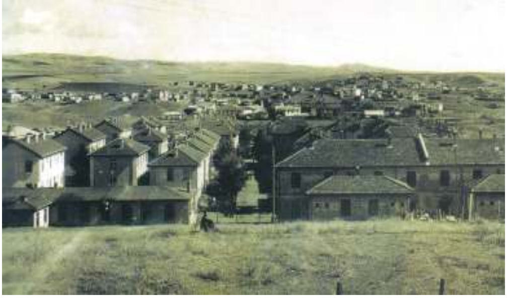
4- Kırıkkale Garnizonu