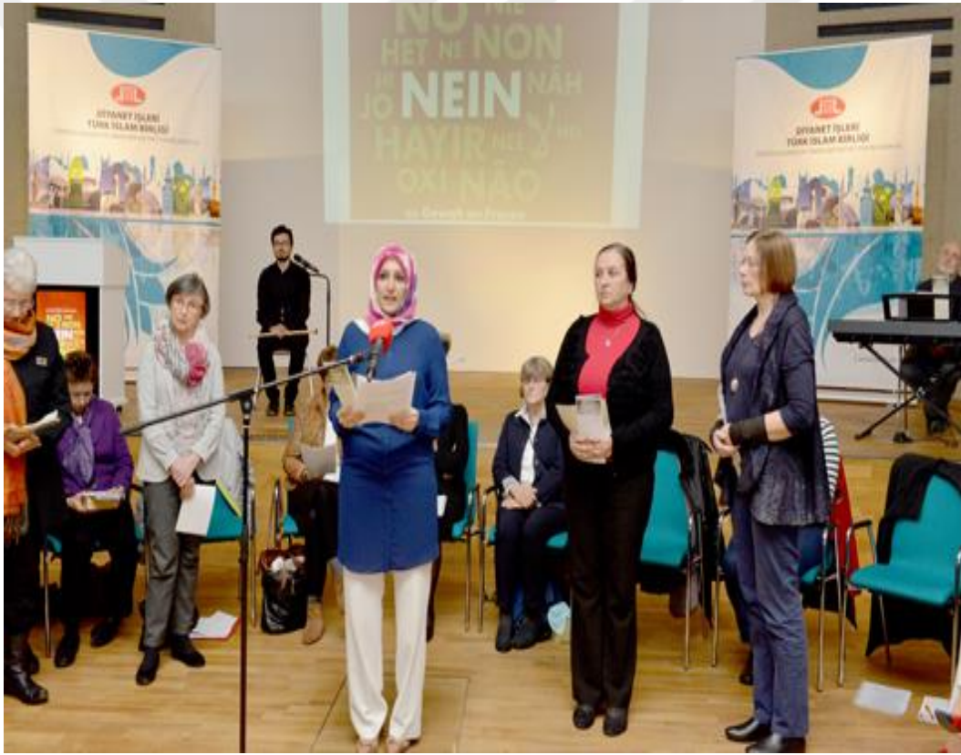
Fotoğraf 14: DİTİB (Diyamet İşleri Türk İslam Birliđi) Haberi ( https://ditib.de/media/Image/haber2016/Nein )