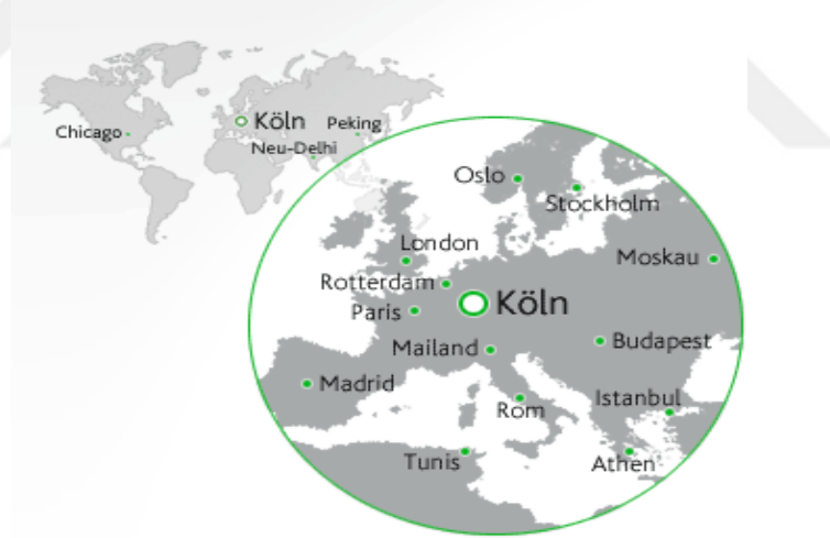
Harita 3: Avrupa ve Dünyada Köln

“Köln Almanya’nın en eski kenti olma özelliğini taşımaktadır. Yaklaşık 2000 yıl önce bir Roma kolonisi olarak kurulmuştur. Adı da buradan gelmektedir. Köln, ülkenin batısında, Almanya’nın en kalabalık eyaleti olan Kuzey Nordreihn-Westfalen’da yer almaktadır. Burası Almanya sanayisinin kalbi, teknoloji merkezi, medya ve kültür merkezi olan bir eyalettir. Eskiden kömür ve çelik sanayisinin merkezi olan bu eyalet son yıllarda geçirdiği değişimle yerli ve yabancı