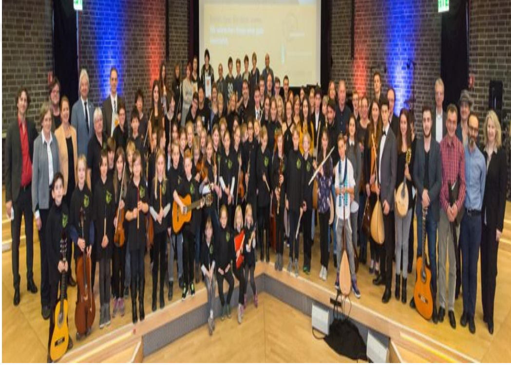
Fotoğraf 4: Monheim Stattiche Musikschule (Monheim Belediye Konservatuarı) Haberi http://sparda-musiknetzwerk.de/wp-content/uploads/2016/07/2016-Slider05.jpg