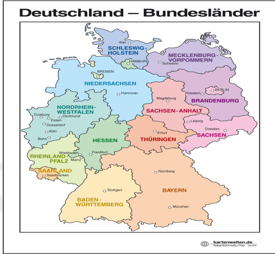
Harita 1: Almanya Siyasi Harita

23 Mayıs 1949 yılında kurulan Federal Almanya, 16 eyaletten oluşur. Günümüz Almanya’ında sanayi devi olarak da tanınan KRV Eyaleti Köln, Düsseldorf, Dortmund, Bochum, Duisburg, Essen, Bonn, Aachen, Bielefeld, Wuppertal gibi önemli şehirleri bünyesinde barındırmakla beraber Alman ekonomisine önemli katkı sağlayan Ford, Bayer, Siemens ve RAG gibi dev kuruluşları da bünyesinde bulunduran önemli bir eyalettir. KRV bu özelliklerinden dolayı, Türkler için göçün merkezi olmuştur. Bugün KRV’de yaşayan ikinci neslin %75’i ve üçüncü neslin ise %100’ü Almanya’da doğmuştur. Günümüz Federal Almanya’ında yaşayan Türklerin 1/3 KRV’de yaşamaktadır” (Bulgan, 2007: 133).