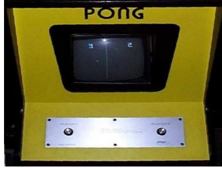
Şekil 2 Pong (today I found Out, 2011).

Aynı firma tarafında 1978 de geliştirilen “ Space Invaders ” ise döneminde popüler olan oyunlardandır. Daha sonra Atari firması jetonlu makinler üretmek dijital oyunlara yeni bir soluk kazandırmıştır (Yılmaz ve Çağiltay, 2007).