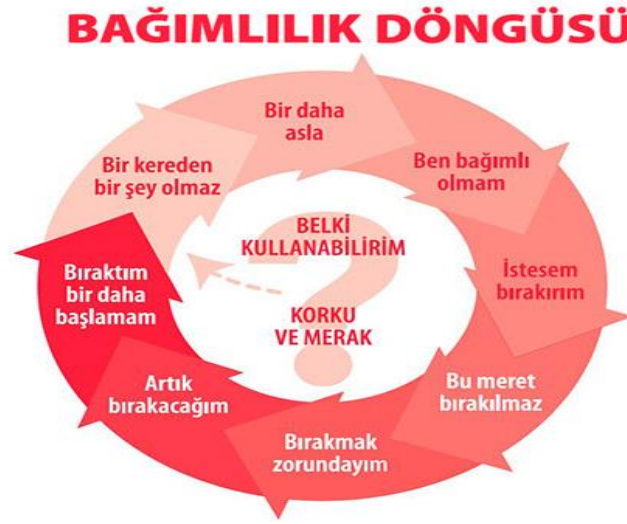
Şekil 5 Bağımlılık Döngüsü (Kızılay, 2018).