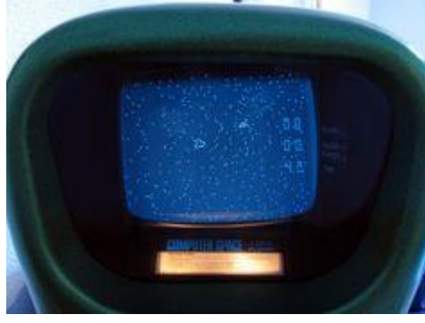
Şekil 4 Computer Space (Pinterest, 2019).

Uzun yıllar yaşamımıza müdahil olan dijital oyunlar 2013 yılında 24,75 milyar dolarlık gelire sahip olmuş, dünya üzerinde 1 milyara yakın kullanıcıya ulaşmıştır (Yalçın Irmak ve Erdoğan, 2016). Belirtilen bu sayının dünya nüfusu ile orantılandığında her 6 kişiden birinin dijital oyun oynadığı ortaya çıkmaktadır. Son yıllarda insan hayatını meşgul etmesine rağmen dijital oyunlar, gelişen teknoloji ile oyunların reel anlamda bir dönüşüm içerisine girmesine fırsat oluşturmuştur (Bozkurt, 2014).