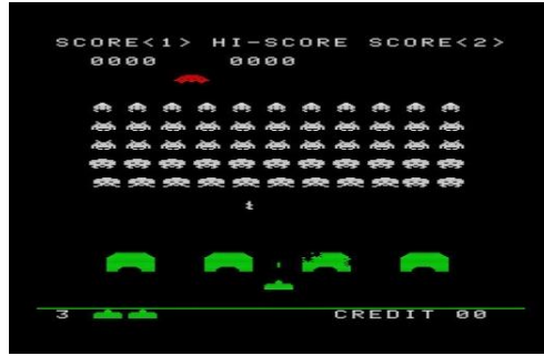
Şekil 3 Space Invaders (Vidya, 2019).

Aynı firma tarafında 1978 de geliştirilen “ Space Invaders ” ise döneminde popüler olan oyunlardandır. Daha sonra Atari firması jetonlu makinler üretmek dijital oyunlara yeni bir soluk kazandırmıştır (Yılmaz ve Çağiltay, 2007).