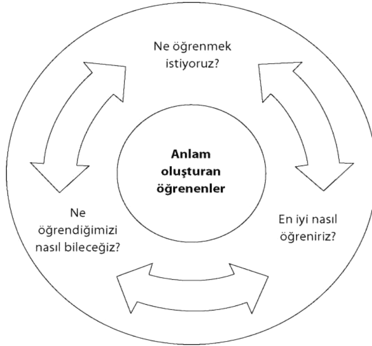
Şekil 2.1. PYP'nin Müfredat Tanımı

Ne öğrendiğimizi nasıl bileceğiz? Ölçülen müfredat (etkili ölçme-değerlendirme kuramı ve uygulaması)