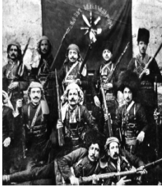
Rusya'nın yanında savaşan bir Ermeni çetesi

Doğu Cephesi'nin kapanmasıyla buradaki birliklerin bir kısmı Batı Cephesi'ne kaydırılmıştır. Halkın gözünde ordu ve Meclis'e duyulan güven artmıştır.