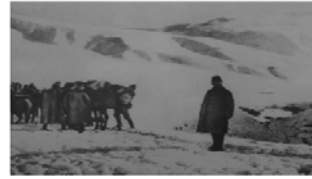
Kafkas Cephesi'nde Ruslara taarruz hazırlanan askerlerimiz (1917)

Rusların 1914 yılında Osmanlı topraklarına saldırısıyla açılan cephede Türk ordusunun karşı taarruzu şiddetli kış ve salgın hastalıklar nedeniyle felakete dönüştü. Çok sayıda şehit ve yaralının verildiği bu cephede Rus ordusu Erzurum, Muş, Bitlis, Erzincan ve Trabzon'u ele geçirdi.