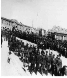
Kars'ın işgalden kurtulması sonrasında Ankara'da yapılan toplantı (1920)