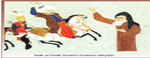
Fatih ve Patrik Ovakim'i Gösteren Minyatür

XVIII. yüzyılda Katolik ve Ortodoks Ermeni cemaati arasında mezhep kavgaları yaşanmaya başladı. Osmanlı Devleti bu anlaşmazlıkların engellemek için 1531'de Katolik Ermeni Patrikhanesi'nin kurulmasına izin verdi. Hıgörü ve özgürlüğün bir sonucu olarak Türklerle en fazla kaynaşan topluluk Ermeniler oldu. Türkçe konuşurlar hatta ibadetlerini bile Türkçe yaptılar. İshak Fermanı'ndan sonra her çeşit devlet memurlarında bulundular. Ermenilerden Osmanlı idaresinde 33