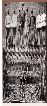
Anapota Ermenilerin Anas Sırası

Osmanlı yönetiminde yaşayan Ermeniler Fransız İhtilalinden etkilenmişlerdi. Bu durum Rusya'nın müdahalesi sonucunda değişti. Rusya XIX. yüzyılın ikinci yarısından itibaren Kafkaslardan Azerbaycan'a ulaşabilmek için Doğu Anadolu'da yaşayan Ermenileri teşvik etmeye başladı. Rus propagandası Ermenileri