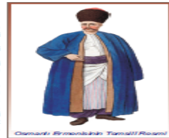
Osmanlı Ermenikinin Temsilî Resmi