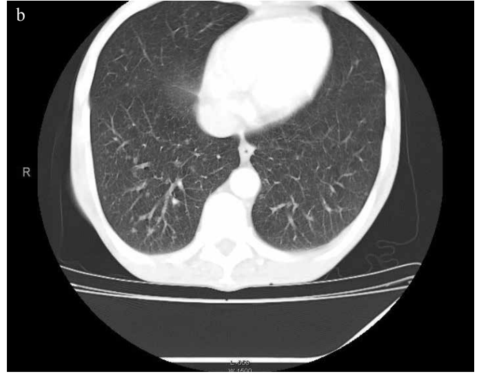
Resim 1 a, b. Hastanın bilgisayarlı toraks tomografisinde bilateral üst lob ağırlıklı dağınık yerleşimli ve düzensiz sınırlı nodüler lezyonlar görülmekte. Bilateral alt loblar ise üst loblara göre kısmen korunmuş görünümde.