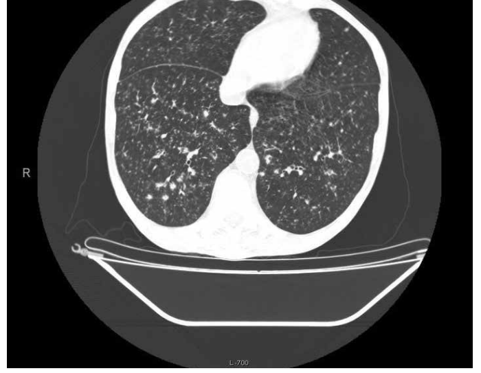
Resim 3. Hastanın 2. bilgisayarlı tomografisinde bilateral alt loblarda mikronodüler bir patern izlenmekte.

larenks tüberkülozu sonucu olduğu düşünülebilir. İlk çekilen toraks BT'sinde endobronşial tutulumla karakterize olan akciğer tüberkülozu olan olgumuz larenks ödemi nedeni ile verilen steroid tedavisi sonucu milyer tüberküloz formuna dönüşerek karşımıza çıkmış olabilir. Yine olgumuzun alkol kullanım öyküsünün olması da milyer tüberküloz formu için risk faktörü olabilir. Tanısı aydınlatılmamış larenks ödemi kliniğinde steroid tedavisi uygularken tüberkülozun da göz önüne alınması gerektiği görülmüştür.