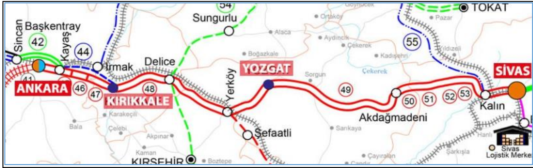
Şekil 2. Ankara-Sivas YHT hattı

Yapım aşamasındaki Ankara-Sivas hattı aynı zamanda İstanbul ile de bağlantılıdır. Böylece İstanbul-Sivas arasını da 5 saate düşürecek bu proje aynı zamanda Konya, İzmir, Bursa bağlantısı da sağlamaktadır. Ayrıca, Sivas'tan sonra Erzincan-Kars'a kadar olan güzergah da aynı şekilde bağlanmış olacaktır. Ankara-Sivas YHT hattı Şekil 2.'de gösterilmektedir.