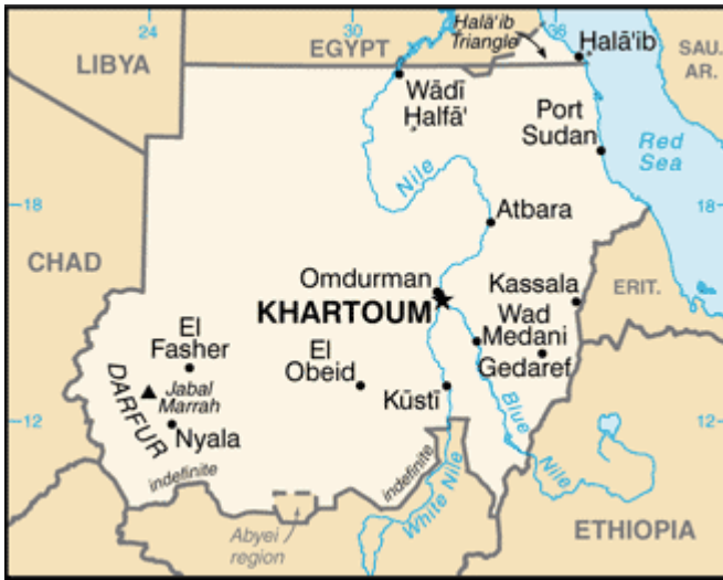
Temmuz 2011 Sonrası Sudan Haritası

Kaynak: https://en.wikipedia.org/wiki/File:Su-map.png#file