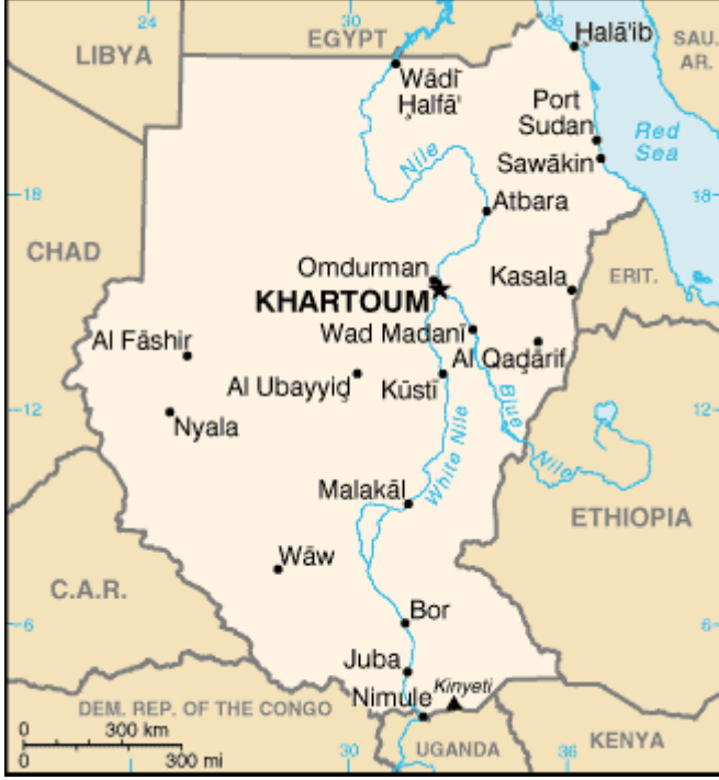
Temmuz 2011 Öncesi Sudan Haritası