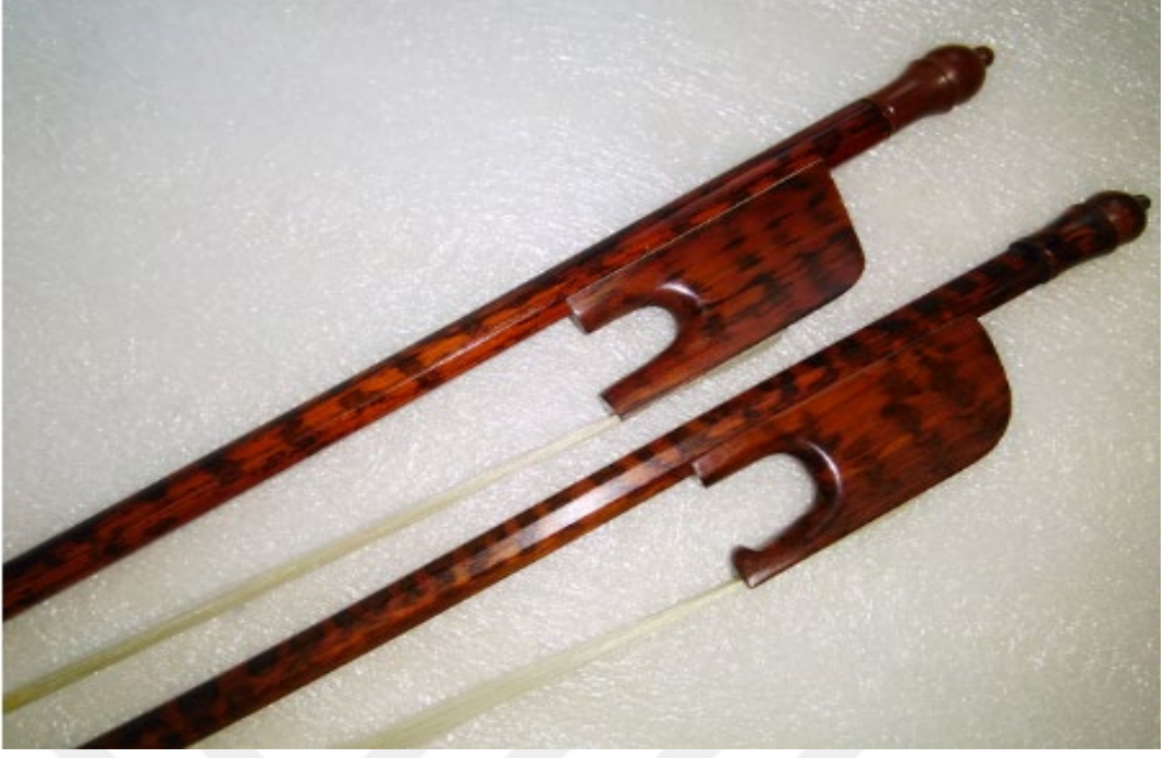
Resim 3: Barok ello eşidi (Erişim 3)