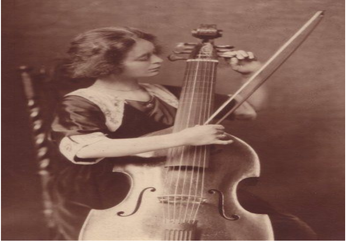
Resim 4: Viola da Gamba (Erişim 4)