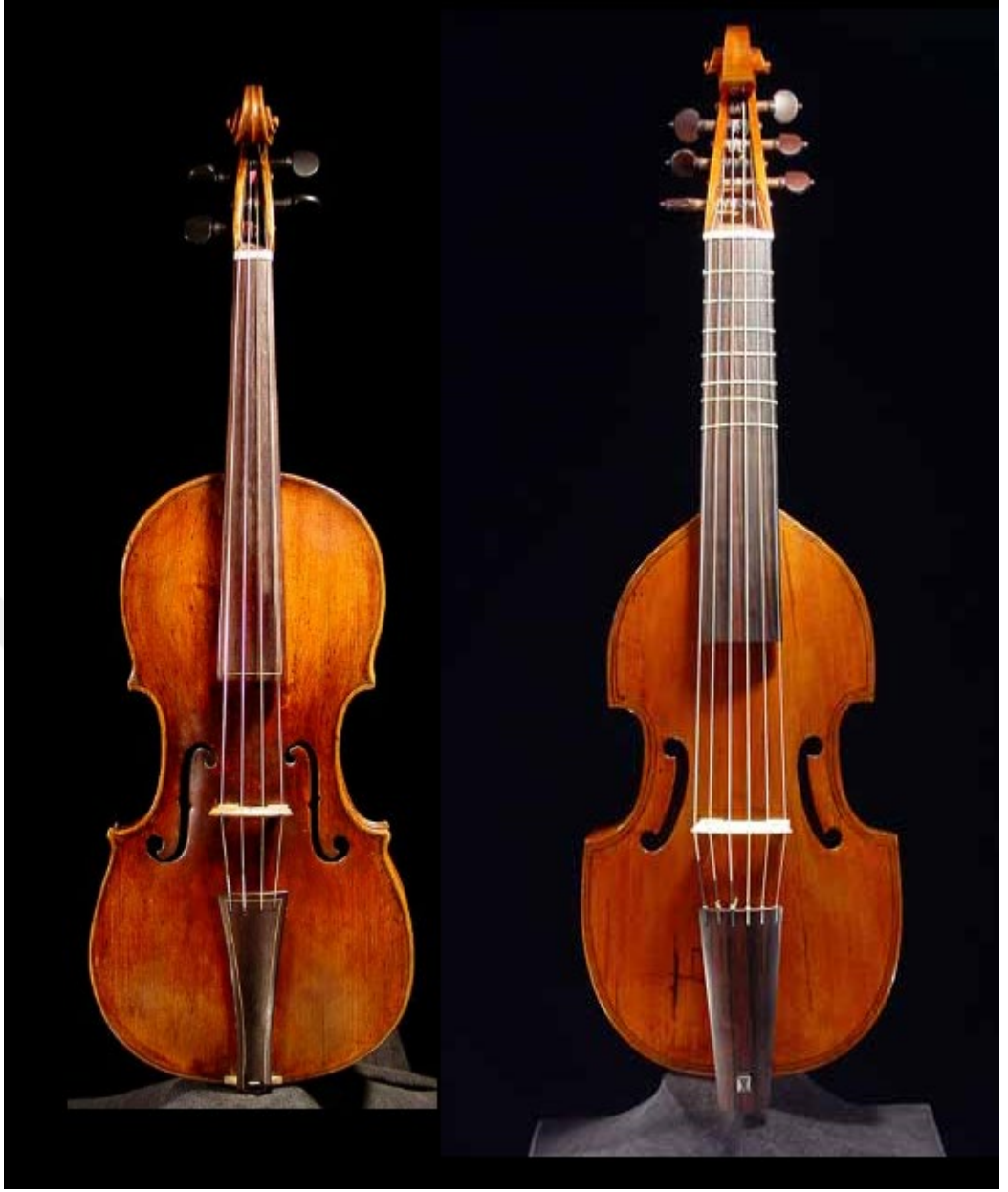
Resim 2: Güncel Viyolonsel ve Viola da Gamba(Erişim 2)