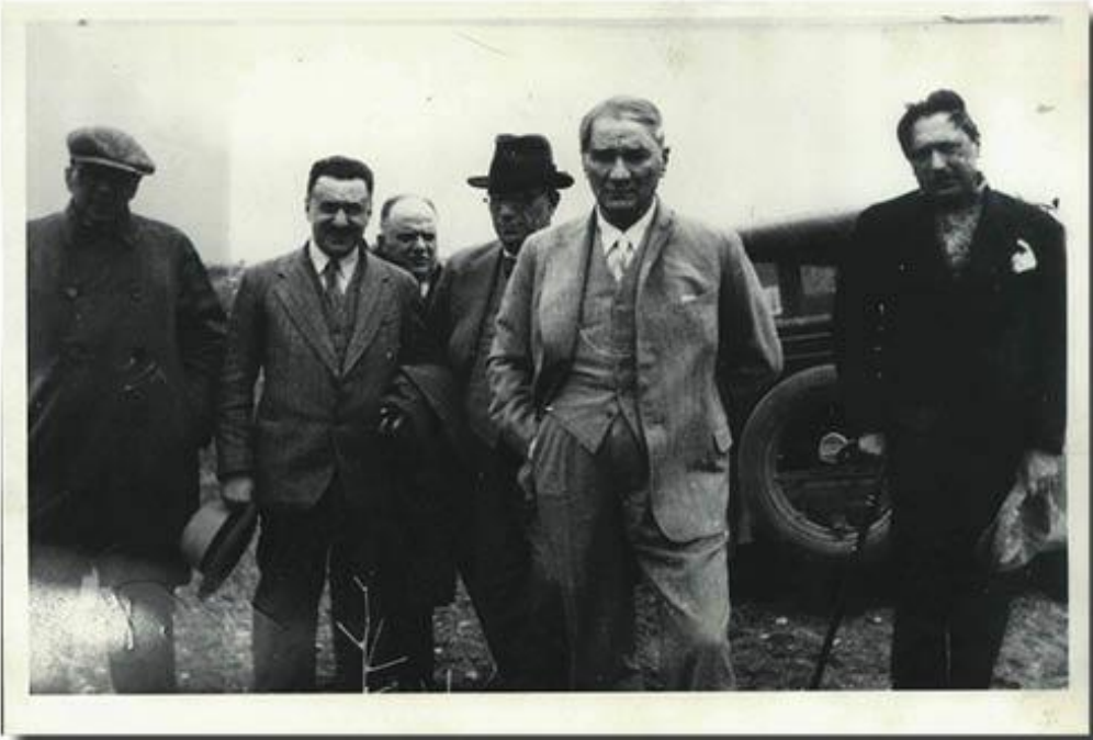
Yusuf Hikmet Bayur, Atatürk ve Reşit Galip