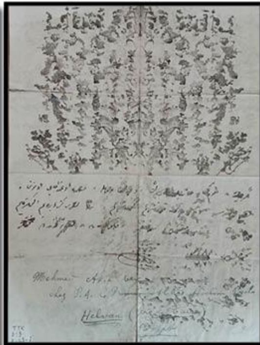
Yusuf Hikmet Bayur'un Mehmet Akif Ersoy'a Yazdığı Mektup