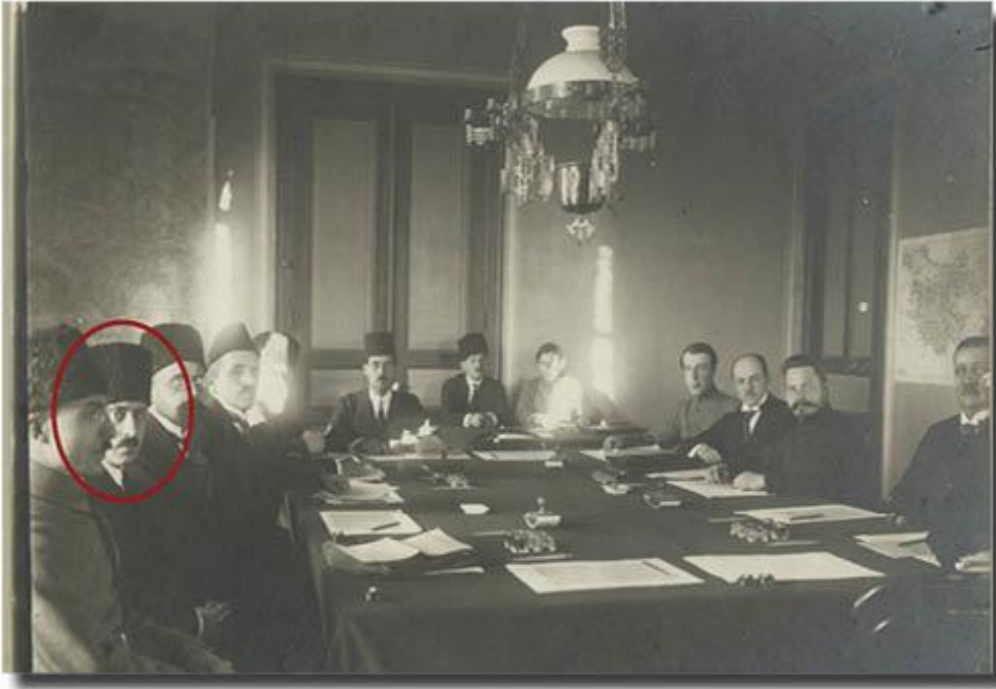
Yusuf Hikmet Bayur'un Hasan Âli Yücel'e İmzaladığı Fotoğrafi