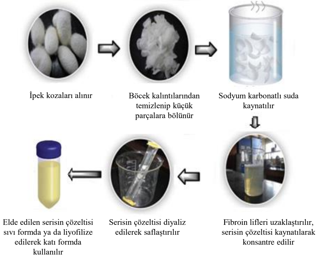
Şekil 2. İpek kozalarından serisin eldesi