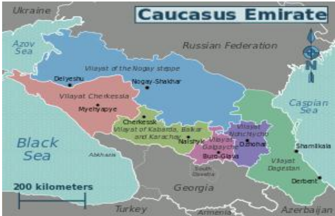
Ek-7: Kafkasya Emirliđi Haritası, https://www.turkebilgi.com/kafkasya_emirliđi