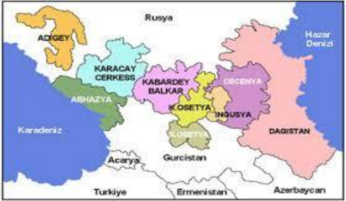
Ek-2: Kuzey Kafkasya'da Bugünkü Özerk Cumhuriyetler, Abhazya ve Güney Osetya, http://politikaakademisi.org/2012/10/02/sistemsel-bir-kirilma-noktasi-kafkasya/