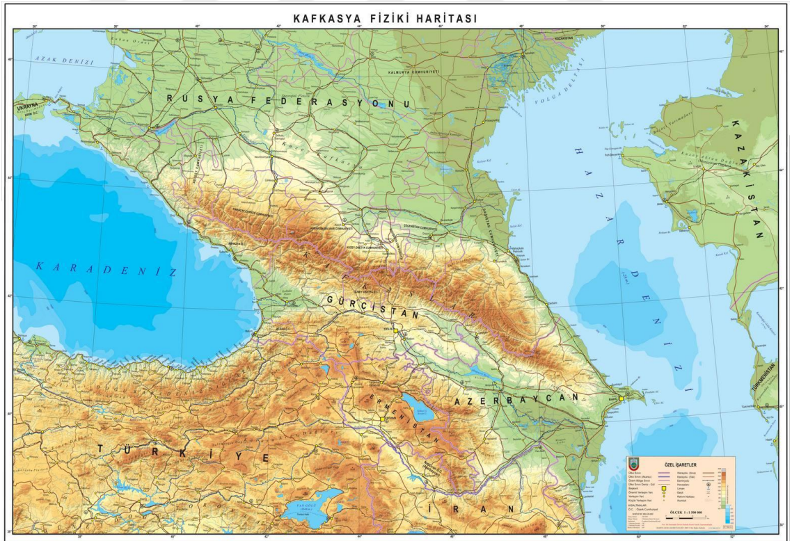
Ek-3: Kafkasya Fiziki Haritası https://www.hgk.msb.gov.tr/urun-13-haritasi.htm