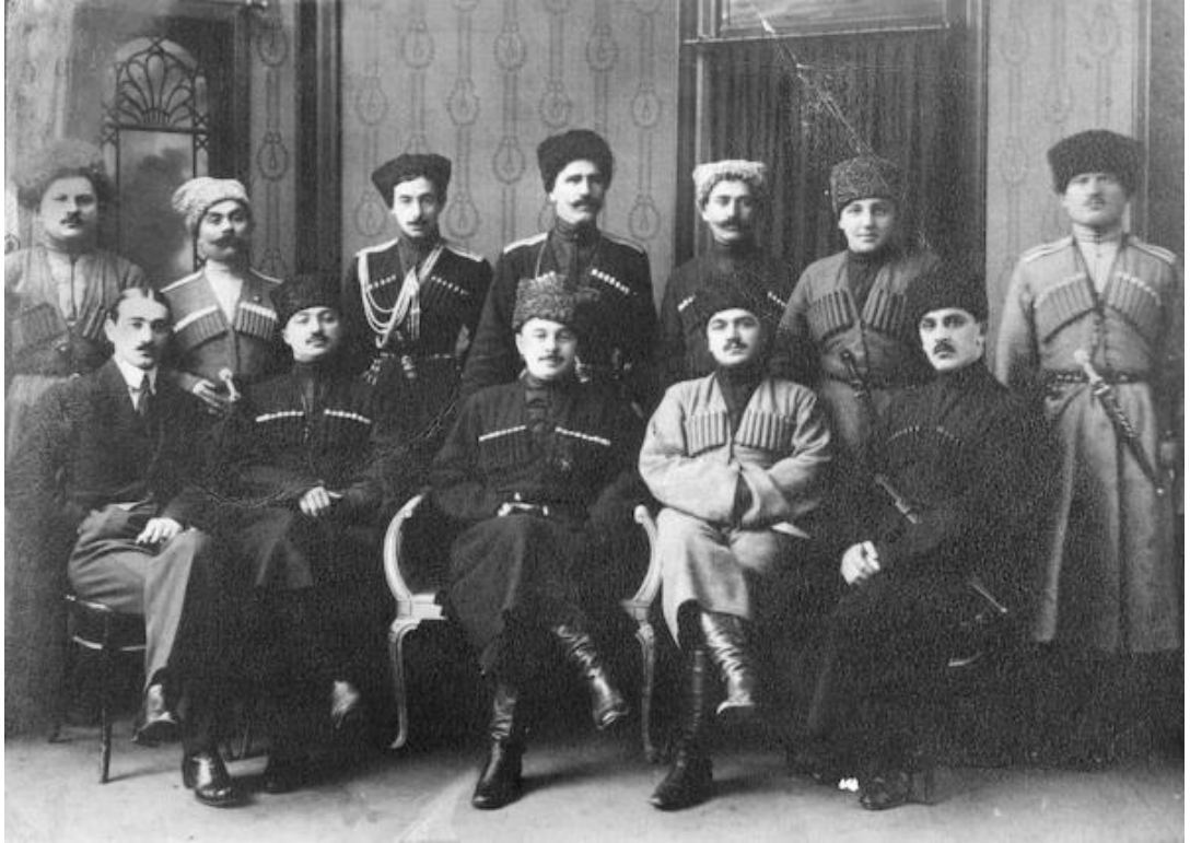
Ek-5: Kuzey Kafkasya Cumhuriyeti Kurucu Liderleri

https://www.dunyabulteni.net/kafkaslar/seyh-samilin-vatani-dagistan-h365677.html