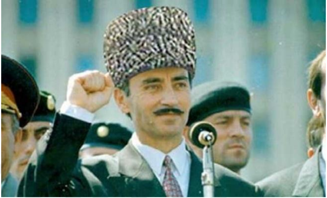
Ek-6: Çeçen-İçkerya Cumhuriyeti I. Devlet Başkanı ve Kurucusu Cevher Dudayev https://www.dunyabulteni.net/kafkaslar/seyh-samilin-izinde-bir-cecen-komutan-dudayev-h327810.html