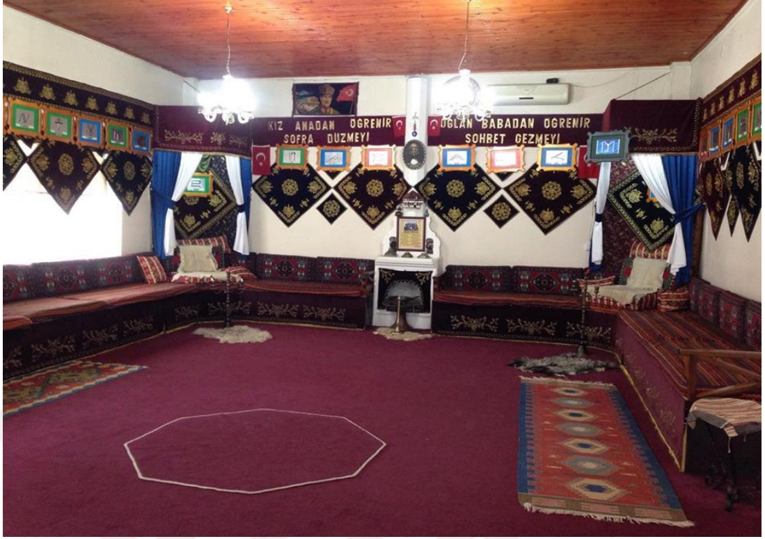
Resim 3: Yaran evi

Yaran odasının duvarları ve yerleri halı ile kaplıdır. Dışarı penceresi varsa bile kapalı bulundurulur. Girişte odanın tam karşı ortasında temsili de olsa bir ocak bulunur. Bu ocağın sağ tarafı büyük Başağa' ya sol tarafı küçük başağ'ya aittir. Ocak bulunmayan mekânlarda ocak yanıyor ise büyük ve küçük başağaların önünde ayaklı şamdanlardan ocak boyunca yanan mumlarla sembolize edilir.