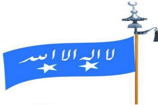
Resim 1. Çankırı Yaran Bayrağı

Çankırı esnafının pek eskiden kalma bir bayrağı vardı. Büyük boyda ve yumuşak bir deriden yapılmıştı. Üzerinde yazılar bulunmaktaydı. Bayramlarda ve törenlerde çıkartılır asılırdı.