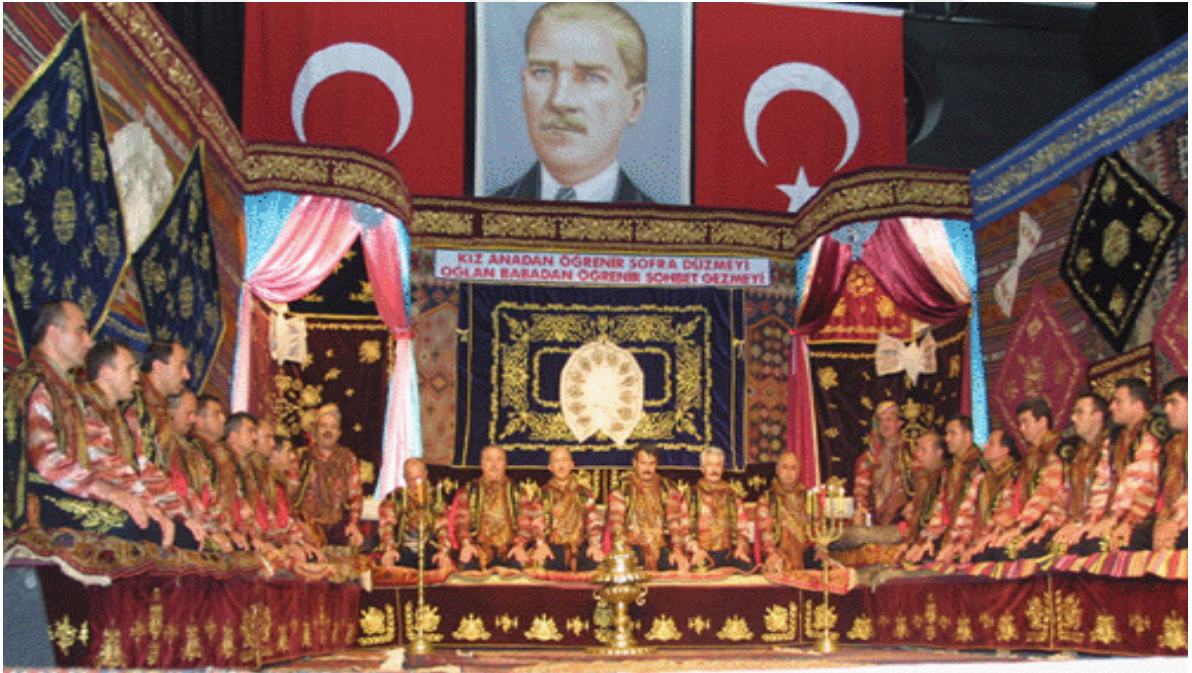
Resim 2: Yaran ağalar

Yaran Reisi Dede Korkut’un da boyu olan Bayat Boyunu temsil eder. Söz ve sohbetine itibar edilen yaşça büyük, başağalardan sonra yaranda söz sahibi olan idarecilerdendir. Yiğit başıdır.