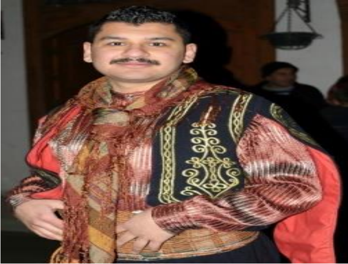
Resim 4: Yaran Giyimi (Absarıoğlu, 2004)

Yaranların misafirlere ayırt edebilmeleri için hemen her dönemde tek tip bir kıyafet uygun görülmüş olup atalarımız tarafından milli kıyafette diyebileceğimiz bir giyim tarzı seçilmiştir. Ayakta beyaz yün çorap, pantolon yerine giyilen sim veya sırma işlemeli arka tarafı körüklü bir zıvga üzerine de içlikte de içlikte denilen yakasız renkli gömlek zıvga üzerine de bele sarılan püskülleri bir taraftan sarkan uzun bir kuşak, bunların üzerine giyilen sim ve sırma işlemeli cepken başa giyilen fes boyuna veya fes üzerine bağlanan poşudan oluşmuştur. Ne var ki günümüzde bu kıyafetleri temin etmek çok pahalı ve meşakkatli olduğu için beyaz çorap, siyah pantolon, beyaz gömlek, kırmızı kravat veya renkli siyah yelek olan bir giyim tarzı uygulanmaktadır. Bu uygulamalar genelde Çankırı merkezde yapılan yaranlarda daha çok göze çarpar ve her yaranında içlik, cepken, zıvga, kuşak ve poşudan oluşan mahalli bir kıyafeti de bulunur. Bu kıyafetleri özel gün ve gecelerde veya reis, küçük başağa, büyük başağa ocaklarında giyerler. Köylerde ve kazalarda yakılan yaran ocaklarında maddi imkânsızlıklar nedeni ile maalesef bu uygulama yapılamamaktadır (Absarıoğlu, 2004).