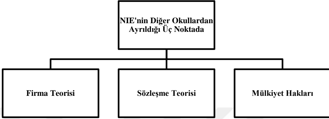
Şekil 1. 2: Yeni kurumsal iktisatı diğer okullardan ayıran kavramlar

Yeni Kurumsal İktisat okulunun diğer okullardan özellikle üç noktada ayrıldığı görülmektedir. Bunlar Şekil 1.2’de görülmektedir.